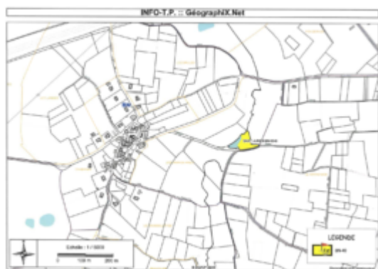
Plan de l'emplacement

Cette parcelle appartient à Monsieur BEAUNIER Jacques. Suite aux négociations engagées avec le propriétaire, il est proposé au Conseil municipal d'acquérir la parcelle cadastrée Section BN n° 49 d'une superficie de 3 560 m 2 au prix de 3 000 euros TTC.