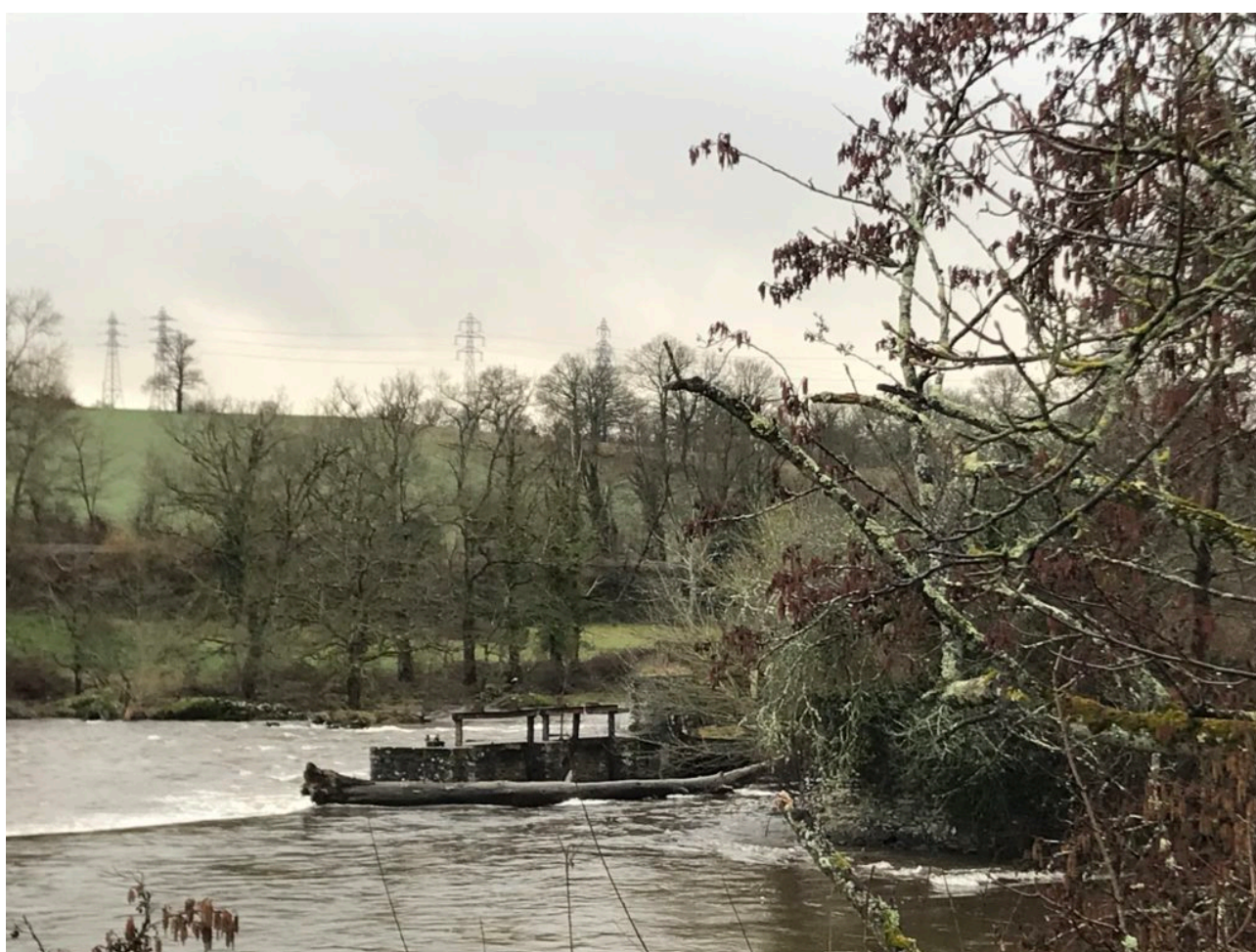
Vue de l'amont (depuis la rive droite)

En résumé, une centrale hydroélectrique composée de 3 turbines va être installée et exploitée par une société privée au moulin Pelgros, propriété de notre commune, situé sur la rive droite de la Vienne le long de la voie d'accès menant à la station d'épuration.