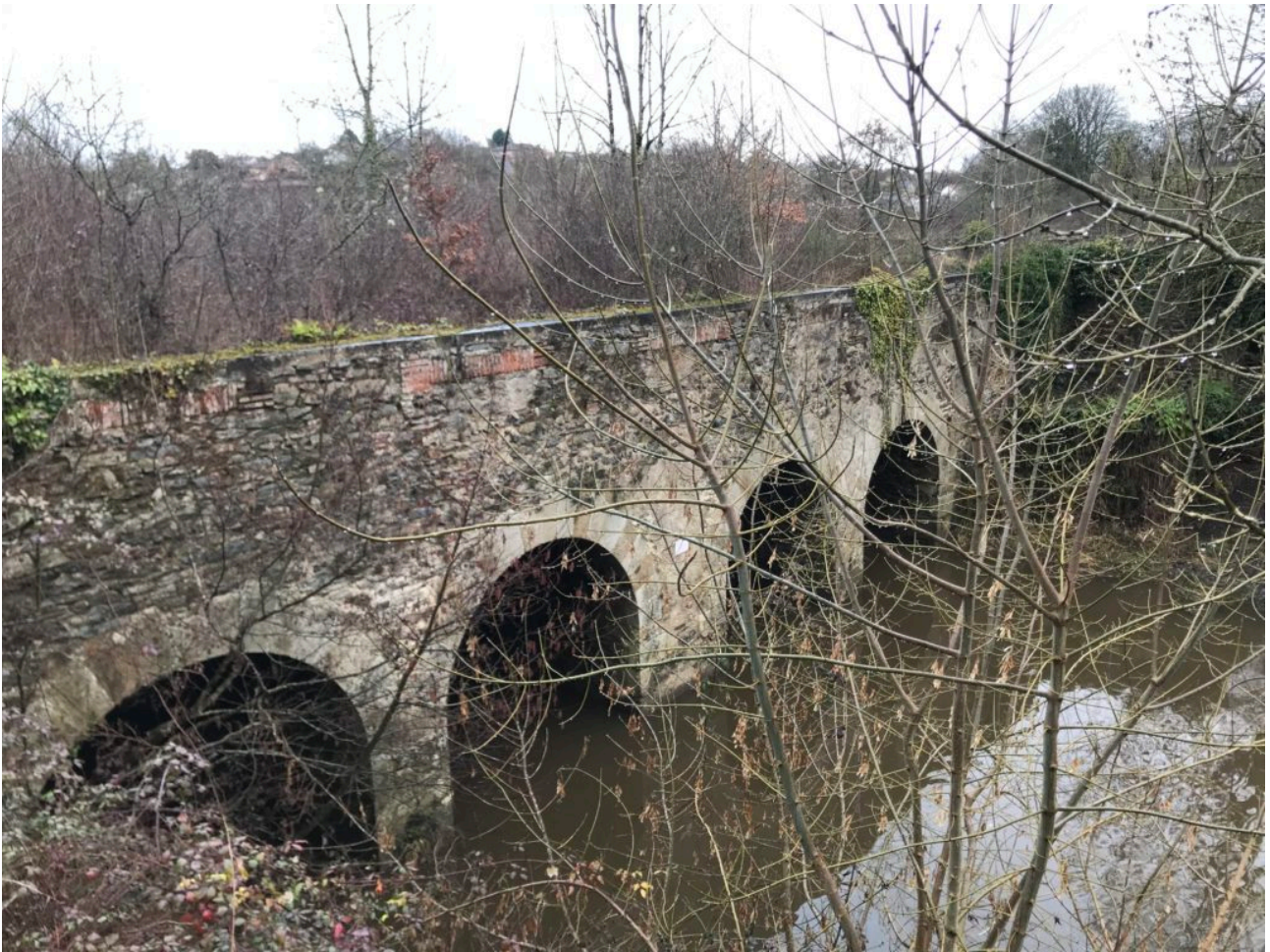
Vue de l'aval

La conception du projet apparaît globalement sérieuse (biodiversité, architecture, etc.) et nous ne pouvons que saluer le développement d'une énergie renouvelable sur notre territoire . À titre d'information, la production correspondrait à l'alimentation en électricité de 530 foyers, hors chauffage et eau chaude.