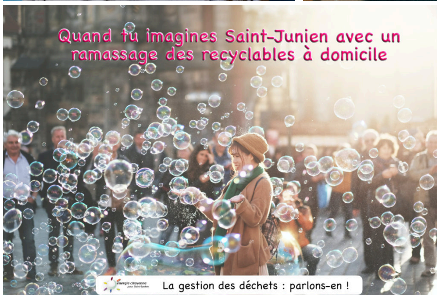
La gestion des déchets : parlons-en !

Quand tu imagines Saint-Junien avec un ramassage des recyclables à domicile