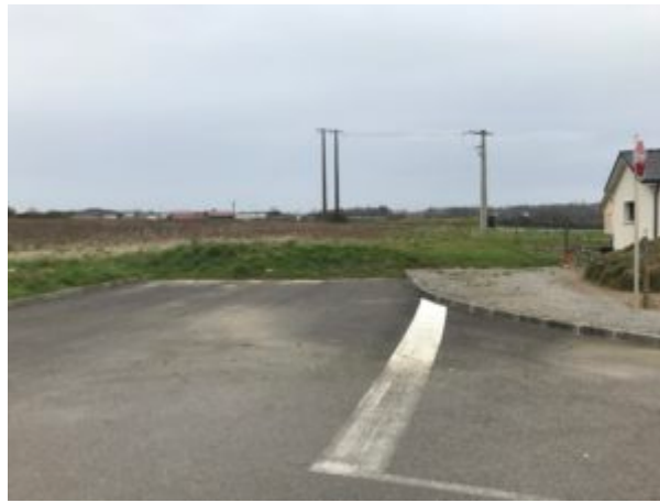
L'impassse actuelle (rue Auguste-Merle, à proximité de Mr.Bricolage)