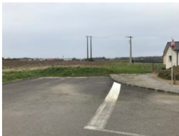
L'impassse actuelle (rue Auguste-Merle, à proximité de Mr.Bricolage)