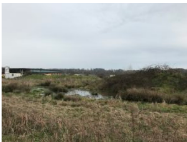
La zone humide