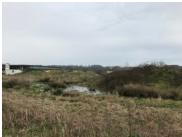
La zone humide