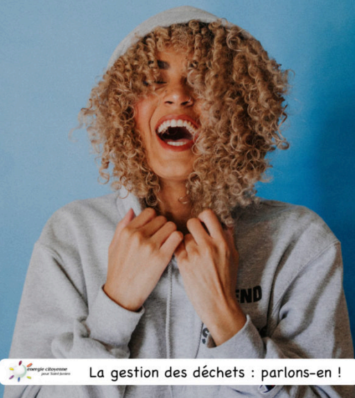
La gestion des déchets : parlons-en !

Quand tu rêves du ramassage des recyclables devant ta porte