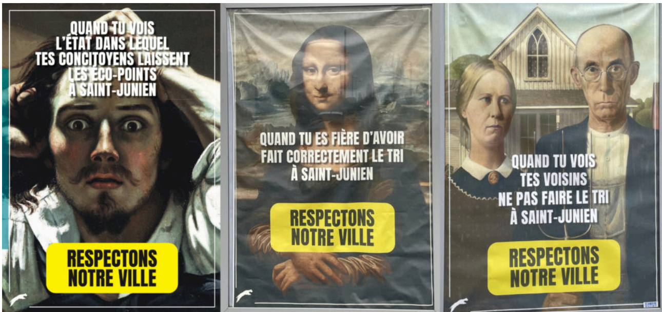
Exemples d'affiches de la campagne de la Ville.