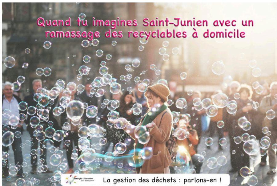
La gestion des déchets : parlons-en !

Quand tu imagines Saint-Junien avec un ramassage des recyclables à domicile