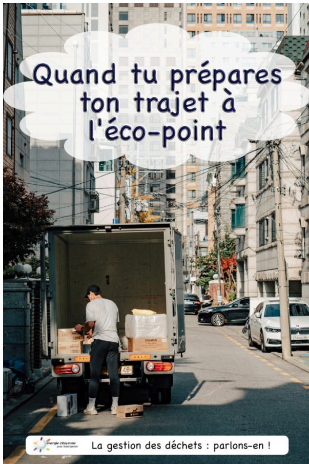
La gestion des déchets : parlons-en !

Quand tu prépares ton trajet à l'éco-point