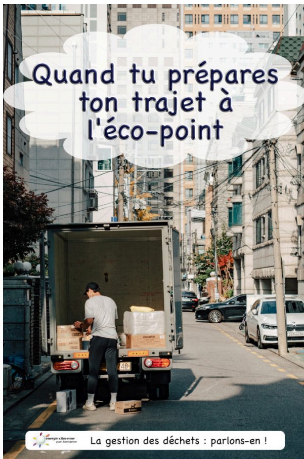
La gestion des déchets : parlons-en !

Quand tu prépares ton trajet à l'éco-point