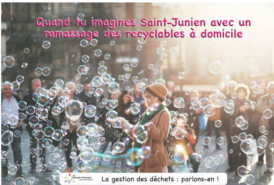
La gestion des déchets : parlons-en !

Quand tu imagines Saint-Junien avec un ramassage des recyclables à domicile