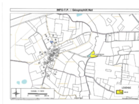
Plan de l'emplacement

Cette parcelle appartient à Monsieur BEAUNIER Jacques. Suite aux négociations engagées avec le propriétaire, il est proposé au Conseil municipal d'acquérir la parcelle cadastrée Section BN n° 49 d'une superficie de 3 560 m 2 au prix de 3 000 euros TTC.